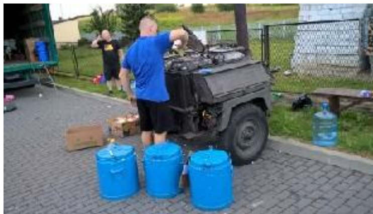
Kolacja prawie 😊 gotowa