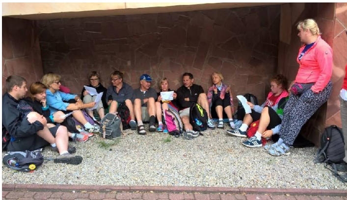
Przygotowania do prezentacji grup...