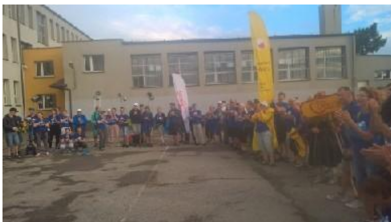
Grupa Karan jest „THE BEST” !!!

„Zwycięża się świat przez Krzyż Pana Jezusa”.