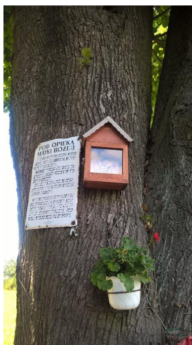
Boże, dziękujemy za przepiękną pogodę ...