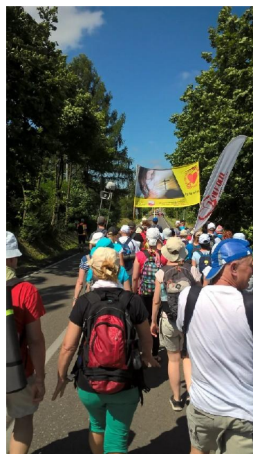
Z pielgrzymiej drogi – z Bożym Błogosławieństwem...