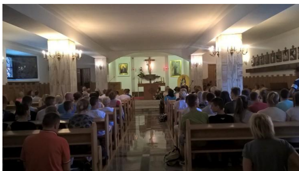
Kaplica Męki Pańskiej w Krakowie - Łagiewnikach.

„Jestem najbardziej wyjątkowym dzieckiem Pana Boga i muszę w to uwierzyć”.